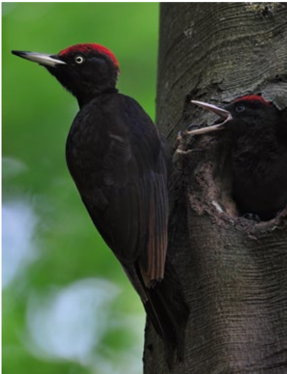
Abb. 3: Schwarzspecht ♂ mit Kontrast auf der Flügeloberseite zwischen blau-schwarzen Mittleren Decken und bräunlichen Großen Decken. Das deutet auf das Formativkleid hin, bei dem diese Federpartien verschiedenen Federgenerationen angehören. Die deutlichen Bleichungs- und Abnutzungsspuren insbesondere der Handschwingen - bei Spechten nicht ungewöhnlich - erschweren die Diagnose.