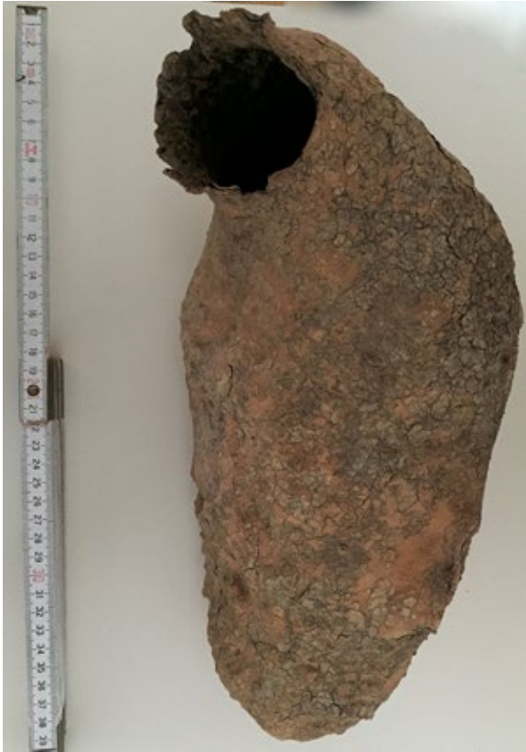
Abb. 2: Alte Höhle des Gilaspechts. Wenn abgestorbene Kakteen verrotten, bleibt die Neststruktur erhalten.