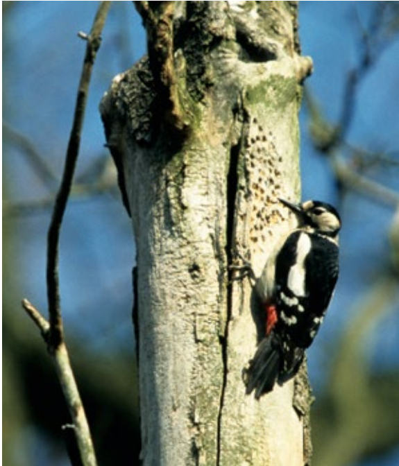
Abb. 2: Buntspecht-Weibchen während einer Trommelpause an einer traditionellen Trommelstelle.

Wallschläger 1980). Häufig trommeln Spechte an besonders geeigneten und von ihnen bevorzugten Trommelplätzen.