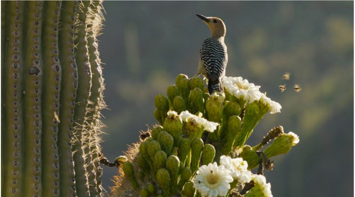
Abb. 3: Gilaspecht-Männchen an der Blüte eines Saguaroakaktus Carnegiea gigantea .