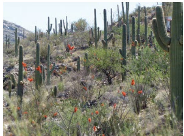
Abb. 1: Habitat des Gilaspechtes Melanerpes uropygialis in der Sonorawüste bei Tuscon/Arizona.

zehenspechtes Picoides tridactylus in lebenden Bäumen (n = 34). Nach einer entsprechenden Auflistung aus dem vom Waldsterben heimgesuchten Schwarzwald befanden sich 18 Höhlen in toten Fichten und nur drei in lebenden Fichten. Das Beispiel zeigt, wie sich Spechte auf die jeweiligen Habitatverhältnisse einstellen können. Auch der Weißrückenspecht Dendrocopos leucotos wählte im Alpenraum überwiegend tote und zuweilen sterbende Bäume zum Höhlenbau (n = 23; Ruge & Weber 1974). Ebenso bauen Kleinspechte Dendrocopos minor ihre Höhlen stets in angemorschtem Holz (Höntsch 2001). Dabei befanden sich die Bruthöhlen