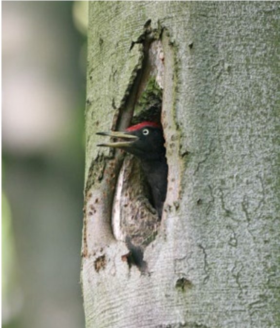
Abb. 1: Schwarzspecht-Männchen singt aus der zukünftigen Bruthöhle.