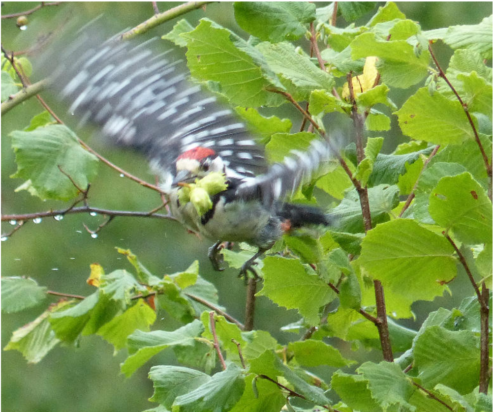
Abb. 5: Buntspecht beim Transport eines Haselnuss-Büschels zur Schmiede 16.8.2015, 11:36 Uhr.