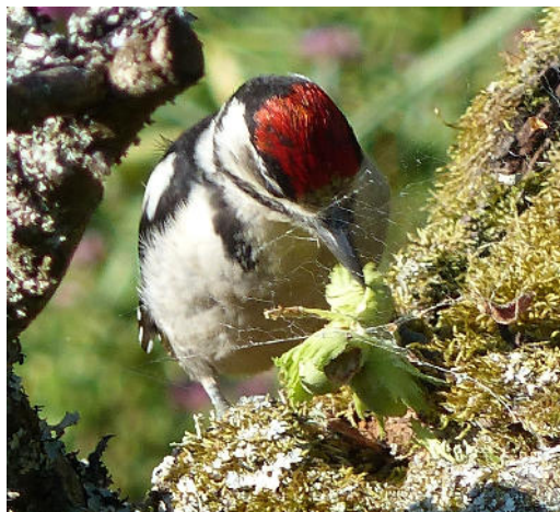
Abb. 1 und 2: Buntspecht mit Haselnuss-Büschel auf Pflaumenbaum am 31.7.2015, 9:42 und 9:48 Uhr.