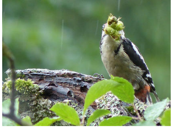
Abb. 3 und 4: Buntspecht mit Nuss-Büschel in Hasel und auf Pflaumenbaum am 4.8.2015, 12:31 und 12:37 Uhr.