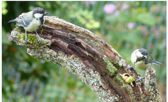
Abb. 7 und 8: Kohlmeisen an Spechtschmiede am 17.8.2015, 10:15 und 10:20 Uhr.

Die Umwandlung des Jugendkleides in das Kleid eines adulten Männchens konnte bei dem Specht in unserem Garten gut beobachtet werden. Vermutlich war es dasselbe Individuum. Am 17.8. trug er noch eine leuchtend rote Kopfkappe (Abb. 7). Am 29.8. erschienen schwarze Federn auf der roten Kopfplatte und neue rote Federn am Hinterkopf. Am 5.9. waren nur noch einzelne rote Federchen auf dem Oberkopf übrig, die am 12.9. verschwunden waren. Dafür war das neue rote Band am Hinterkopf gewachsen und leuchtete wie beim adulten Männchen (Abb. 9 und 10). Bei diesen Aufnahmen zeigt die Schwarzweiß-Zeichnung auf dem linken Unterflügel, dass es sich um dasselbe Individuum handelt.