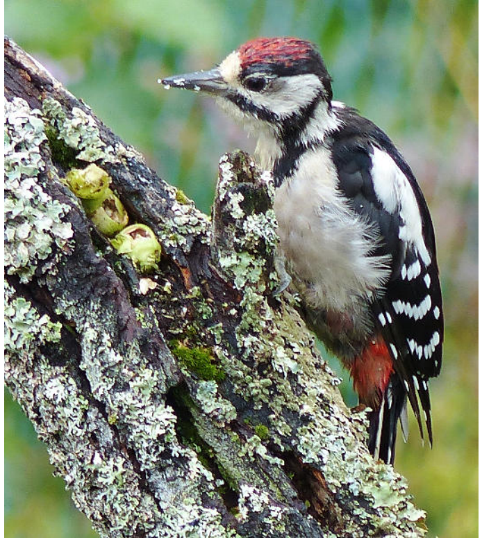
Abb. 6: Buntspecht an Schmiede mit eingekleiteten Nüssen auf Pflaumenbaum am 16.8.2015, 12:50 Uhr.